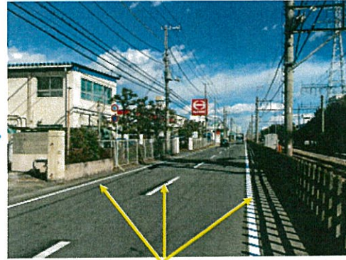
センターライン・区画線の引き直しが完了