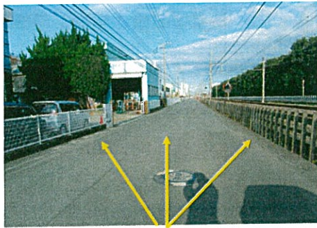
センターラインと区画線が消えている