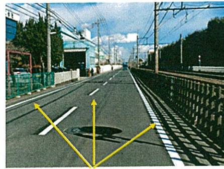
センターライン・区画線の引き直しが完了