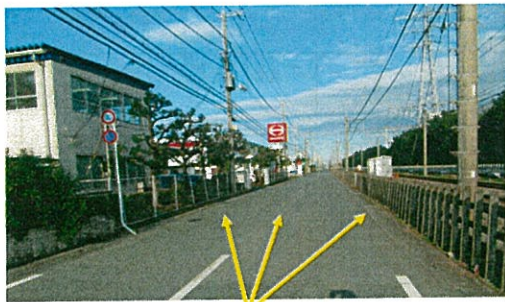
センターラインと区画線が消えている