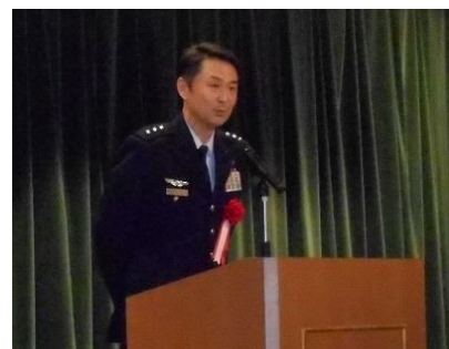
引田航空自衛隊中部航空方面隊司令官様