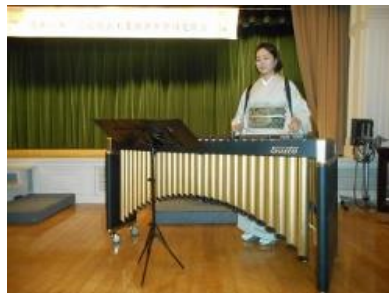
マリピ(マリンバ&ピアノデュオ)