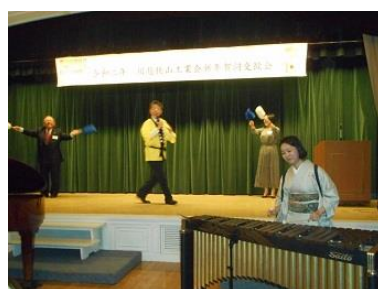
入間市工業会 寺園会長様